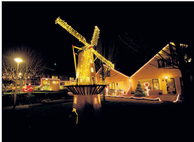
■ De Vicariehof in Beneden-Leeuwen maakt traditiegetrouw veel werk van Lauwe on Light. foto Eveline van Elk